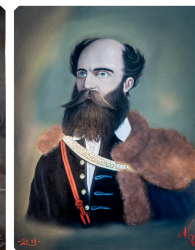
Festmény Németh Viktor alkotása