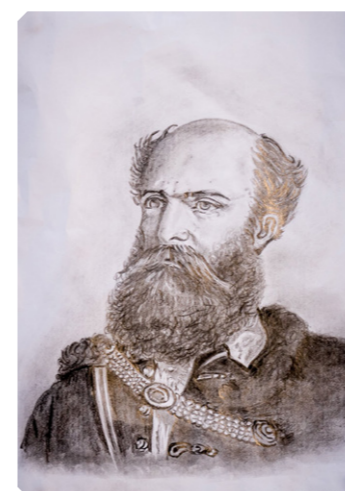
Ceruzarajz Drozdik György alkotása

A Művelődési, Oktatási és Sport Alapítvány által Batthyány Lajos miniszterelnök halálának 170. évfordulója alkalmából kiírt pályázatának díjazottjai