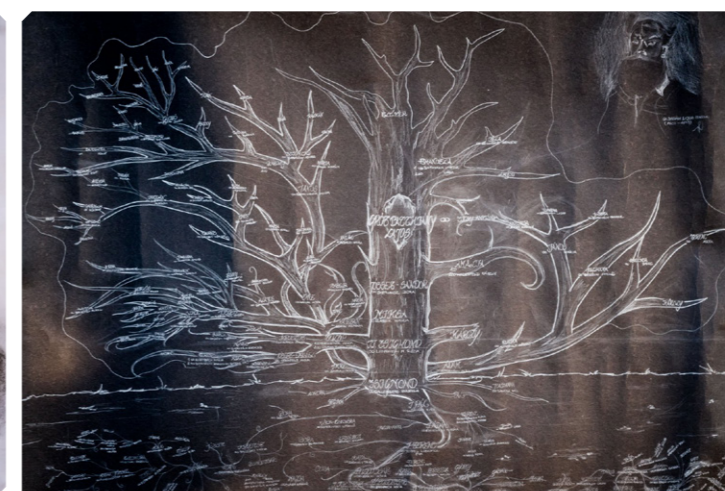
Családfa Vékony Anett alkotása